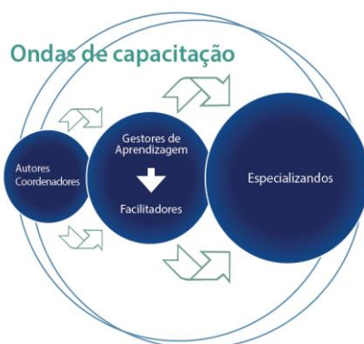
Figura 1. Representação das ondas de formação dos cursos de especialização em parceria com o SUS, IEP/HSL, 2016.

Os cursos de pós-graduação do IEP/HSL são orientados por competência profissional e utilizam abordagens pedagógicas inovadoras, incluindo a aprendizagem baseada em problemas – ABP, a problematização, a aprendizagem baseada em equipes – TBL, a educação a distância – EAD e a avaliação baseada em critérios. Todos originam projetos aplicativos de intervenção na realidade.