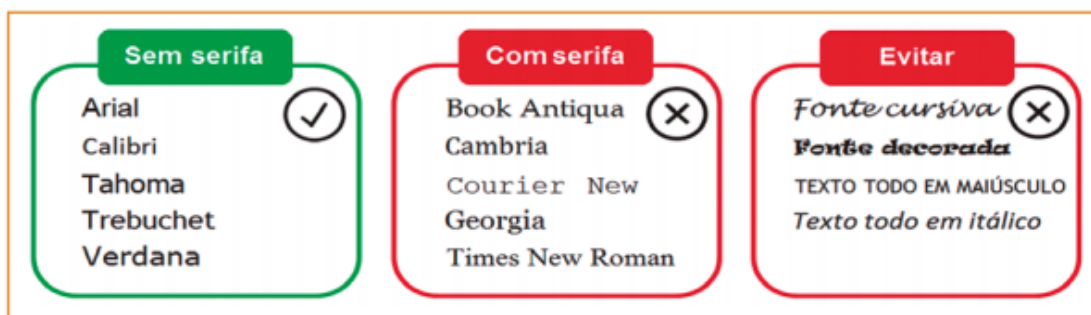
Figura 1 - Exemplos de fontes sem serifa, com serifa e do que deve ser evitado