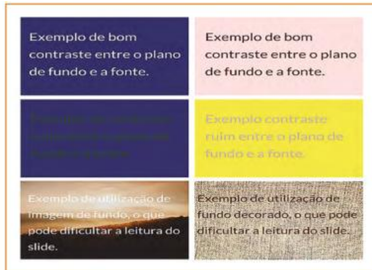
Figura 3 - Exemplo de contrastes efetivos e não efetivos entre texto e plano de fundo