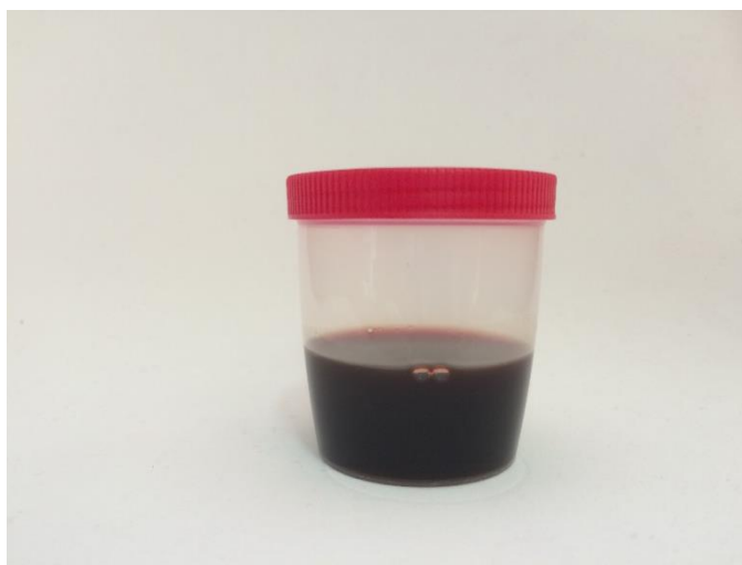
Figura 1. Aspecto macroscópico da urina coleta do equino 7 após o treinamento do grupo 2. (espaçamento 1,0, fonte tamanho12)