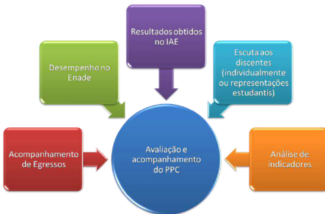
Figura 6 - Estratégias para desenvolvimento do processo de avaliação e acompanhamento do Projeto Pedagógico do Curso de Engenharia de Produção.

O PPC deverá ser apreciado e aprovado pelos órgãos consultivos e deliberativos da UFVJM, incluídos o Colegiado do Curso, o Conselho de Graduação (CONGRAD) e o Conselho de Ensino, Pesquisa e Extensão (CONSEPE).