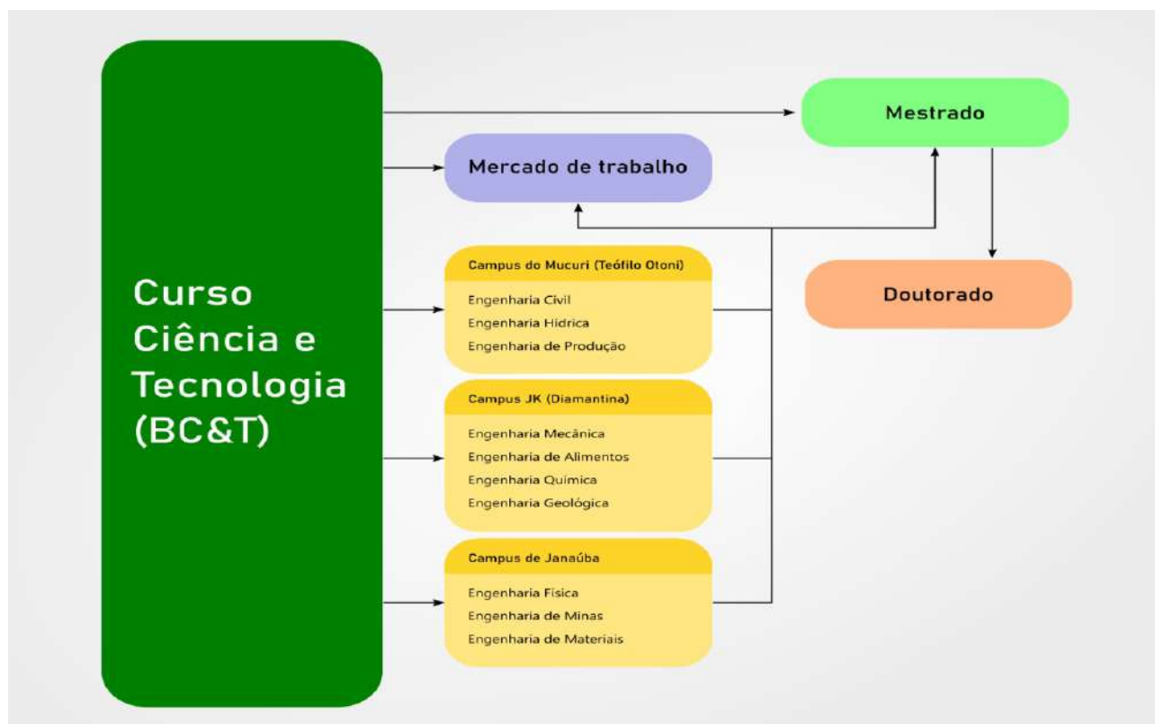
Figura 1: Percursos acadêmicos possíveis aos discentes do BC&T.

O segundo ciclo de estudos, de caráter opcional, estará dedicado à formação profissional em áreas específicas do conhecimento. O terceiro ciclo compreende a pós-graduação Stricto sensu , que poderá contar com alunos egressos do BC&T.