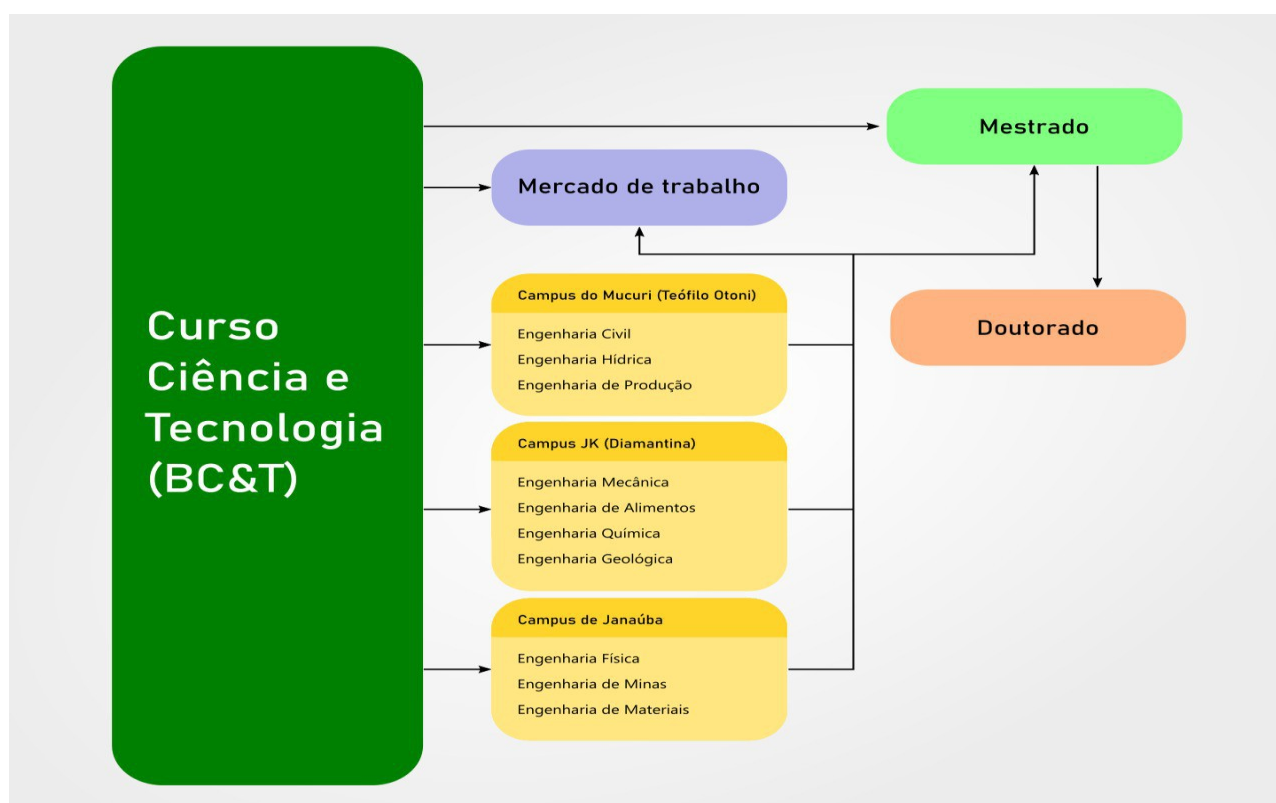
Figura 1: Percursos acadêmicos possíveis aos discentes do BC&T.

O segundo ciclo de estudos, de caráter opcional, estará dedicado à formação profissional em áreas específicas do conhecimento. O terceiro ciclo compreende a pós-graduação Stricto sensu , que poderá contar com alunos egressos do BC&T.