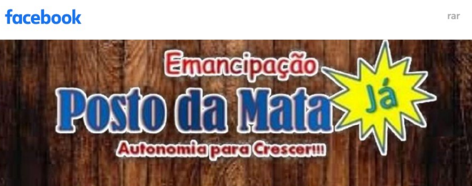
Figura 02. Campanha de emancipação numa rede social no ano de 2021

Ainda que possa parecer que a popularização da internet chegou à todos os lugares, é importante reforçar que no ano de 2022, no Brasil, havia 36 milhões na acessaram a internet 2 , sobretudo, por pessoas pertencentes as classe D e E, população majoritária nos distritos. Portanto, nesse sentido, Arraial D’Ajuda, Posto da Mata e Itabatã podem ser considerados territórios privilegiados.